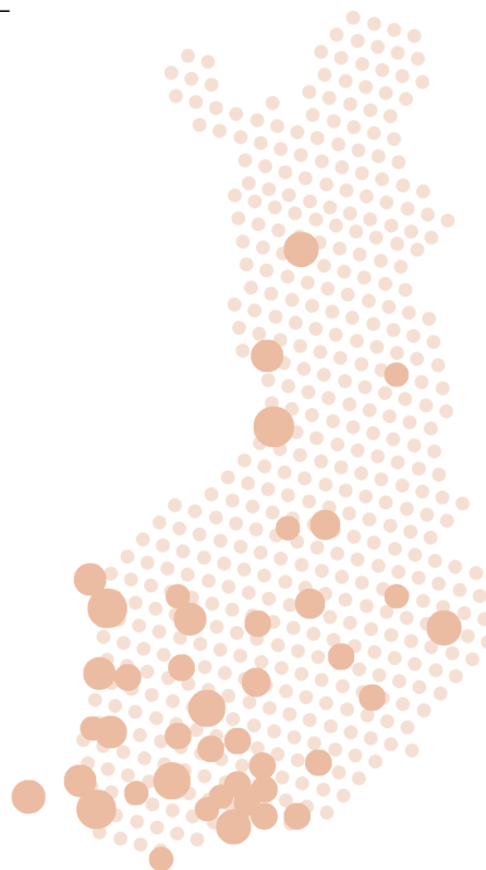
Liiton jäsenyhteisöjen, taiteilijaseurojen verkosto kattaa laajasti koko maan.

Kuvataiteen tiheä järjestökenttä kattaa koko maan. Alueillaan vaikuttavat taiteilijaseurat