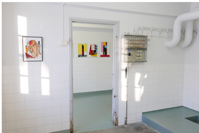
Liitto sai toimintavuonna uudeksi jäsenyhteisökseen Sipoon Taiteilijat ry:n. Kuvassa yhdistyksen Sipoon Nikkilän vanhassa mielisairaalan pesulan tiloissa toimiva Pesula Galleria.

Liitto panosti toimintavuoden aikana kriisiajan viestintään, keräsi tietoa taiteilijaseurojen tulonmenetyksistä sekä avasi yhteistyön Senaatti-kiinteistöjen kanssa ympäri maata sijaitsevien tyhjien tilojen tarjoamiseksi näyttelyjärjestäjille näyttelytiloiksi.