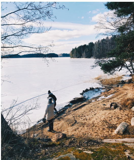
Liiton ylläpitämä taiteilijaresidenssi, Aspan ateljee, sijaitsee Karjalohjalla, Lohjanjärven rannalla.

Jäsenyhteisöjen toiveiden ja tarpeiden kartoittamiseksi, liiton jäsenpalvelujen kehittämiseksi sekä edunvalvontatyön tehostamiseksi toteutettiin toimintavuoden aluksi jäsenistölle suunnattu kirjallinen kysely. Vuoden aikana käynnistettiin myös etäyhteyksin toteutuneet jäsenyhteisötapaamiset. Tapaamisten tavoitteena oli kyselyn tapaan kerätä liiton toiminnan kehittämisen kannalta tärkeää tietoa. Liiton palvelujen kehittämistä jatkettiin kerätyn tiedon pohjalta.